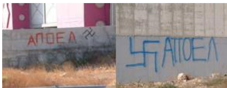
Σβάστικες μαζί με τη λέξη ΑΠΟΕΛ, σε τοίχο υπεραγοράς στη Λευκωσία.